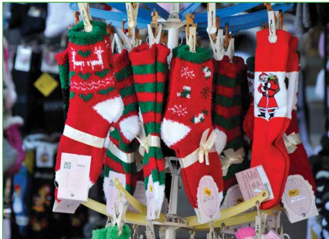
A karácsonyi vásárokon évek óta egyre kevesebb a megtévesztés